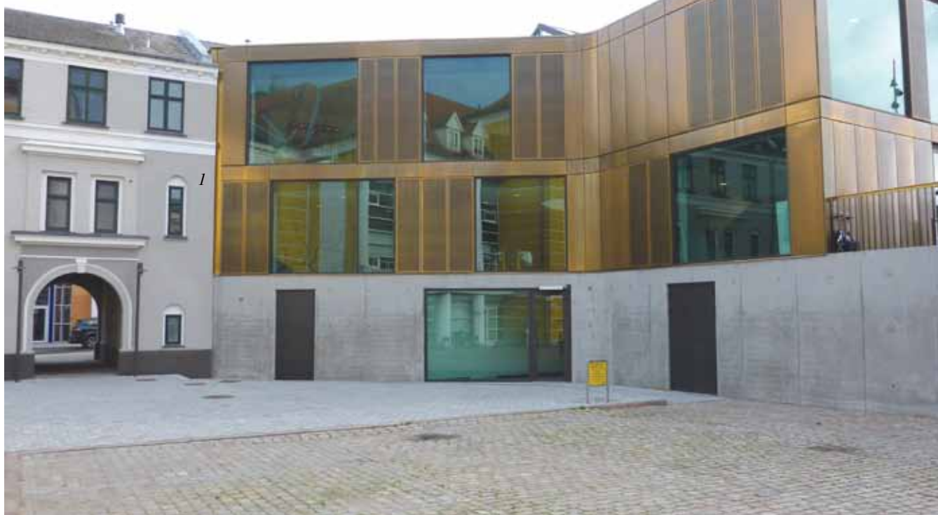
Bygningens plint i insitu - beton starter ved teatret, fortsætter hen til trappen op til terrassen og videre ned over terrænet i en lang glidende bevægelse.

Kælderen er anvendt til garderobe og toiletter mm.. Garderoberrummet kan desuden bruges til udstillinger og galleri. Fra kælderen er der direkte udgang til Ramsherred.