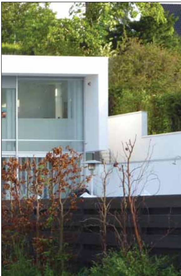
Materialeholdningen er hvidpussede facader med alluvinduer.