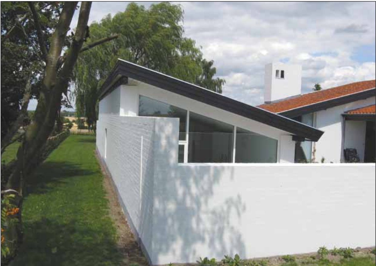
Tilbygningen er opført i murværk og fremstår med hvide pudsede facader.