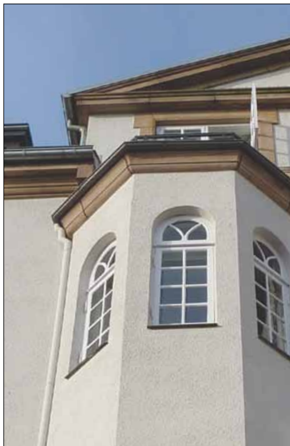
Bygningen blev tegnet af Andreas Jensen og opført i nyklassicistisk stil med referencer til historismen, en periode hvor de klassiske stilarter blev blandet efter forgodtbefindende, en slags "katalog-arkitektur".