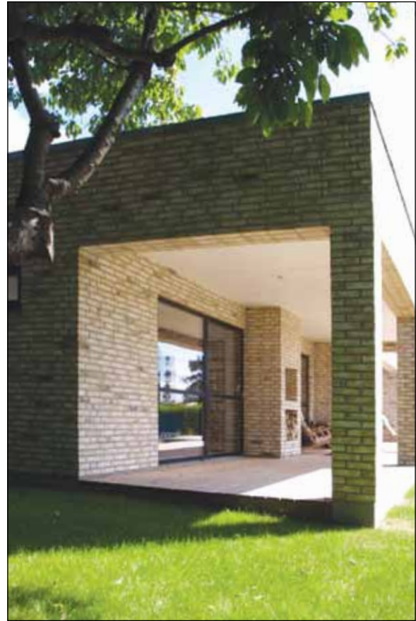
Karakteristisk for husets udtryk er den store overdækkede terrasse udført i murværk og med murede kvadratiske søjler.