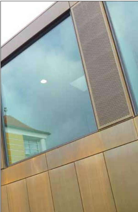
Frisk luft trækkes ind gennem de perforerede partier og videre ind til foyeren gennem mekanisk styrede opluk i væggene.