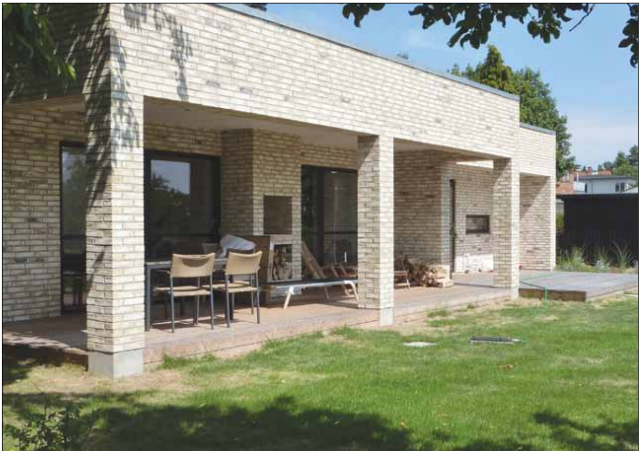
Teglstenene er anvendt til at skabe skulpturelle bygningsvolumener og indgår ikke kun som simpel facadebeklædning.