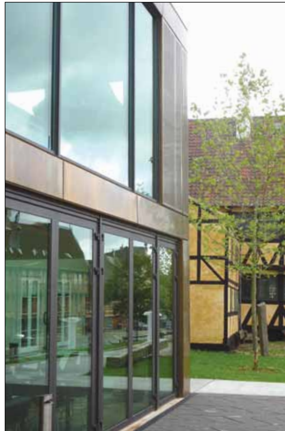
Facaderne er beklædt med Tombak / byggebronze der patinerer til en mørk gylden nuance.