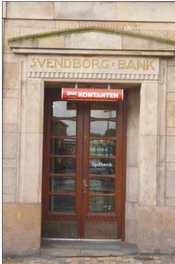
Hovedindgang fra Klosterplads.