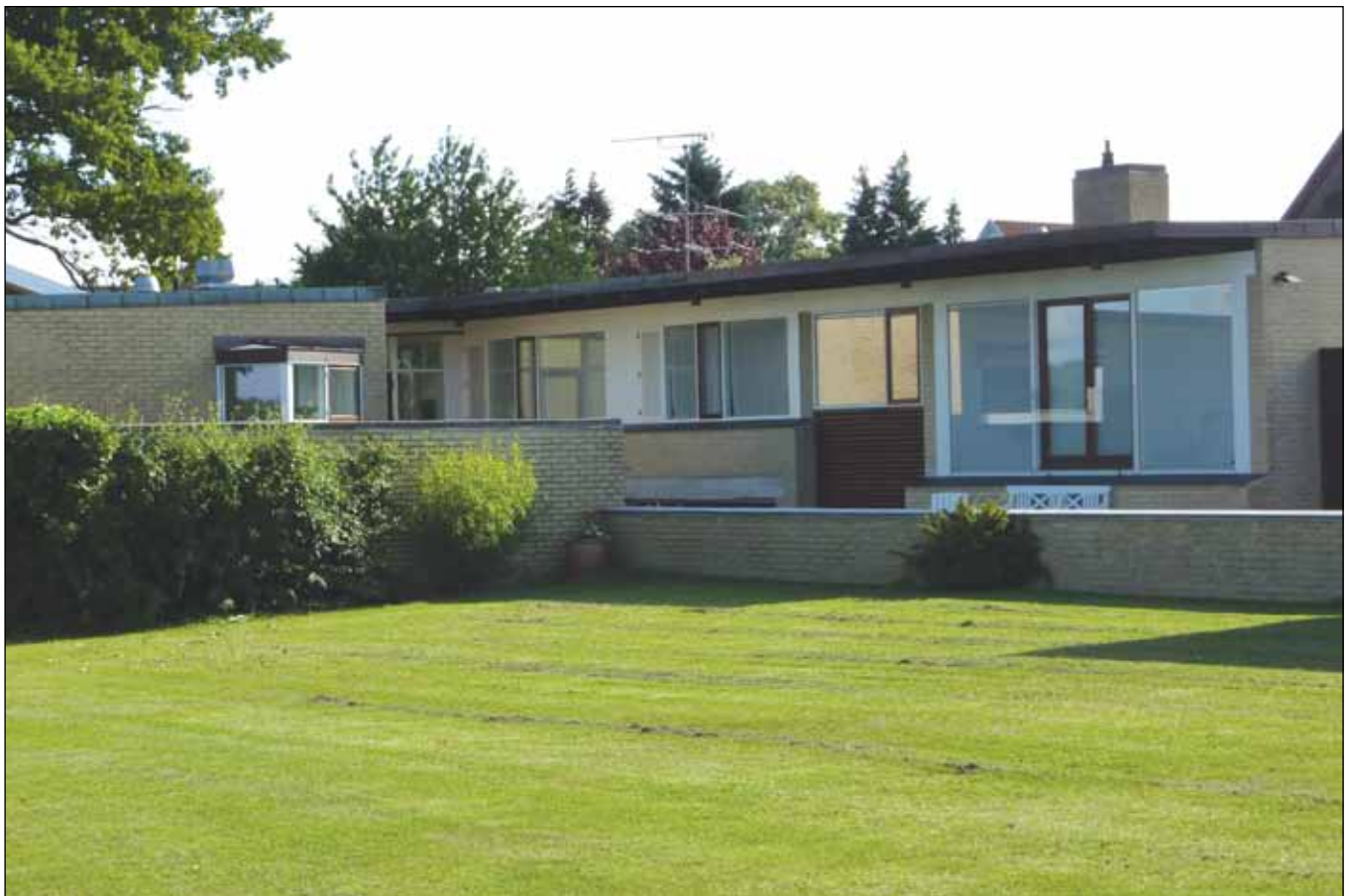
Facaden mod haven og Svendborg Sund. Huset er opført i lyse gule blødstrogne teglsten og har fladt tag med kobberinddækninger.

En ny tilbygning er blevet opført efter C & W arkitekter anvisninger og består af en mindre udbygning, som tilpasser sig husets oprindelige arkitektur. Bygningen indeholder en ny soveafdeling med bad og toilet. Tilbygningen er fint tilpasset den eksisterende arkitektur og fremstår i harmoni med dette.