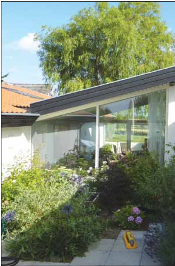
En af mange udeopholdsrum.