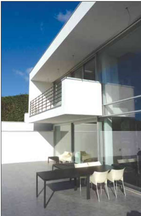
Langs hele facaden mod vandet er der visuel kontakt med omgivelserne og mulighed for udgang hertil.