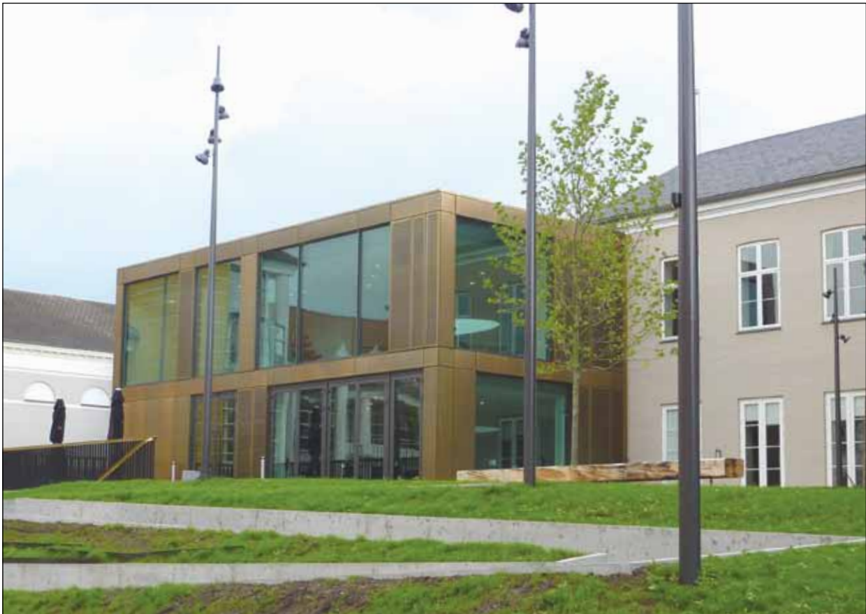
Ankomst til kulturhuset sker via Promenaderampen, der løber i niveau med terrænet og skaber forbindelse fra gadens niveau på Ramsherred til Borgerforeningens indgang i syd.