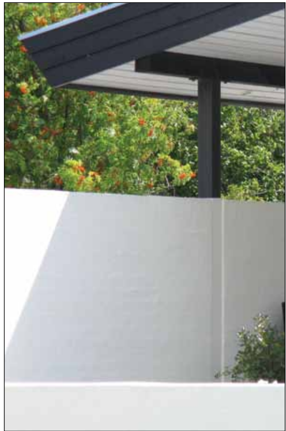
Eksempel på en enkelt tagkonstruktion.