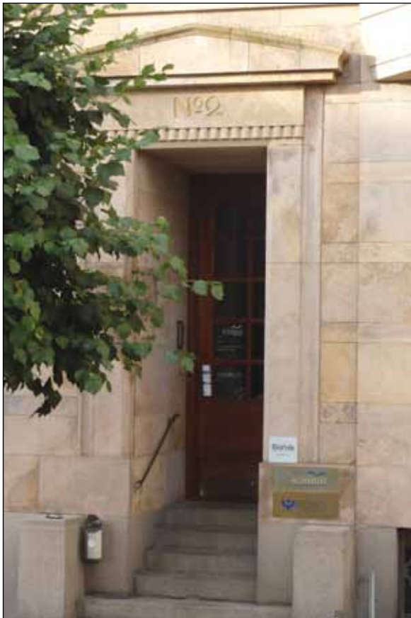
Indgang til øvrige lejemål.