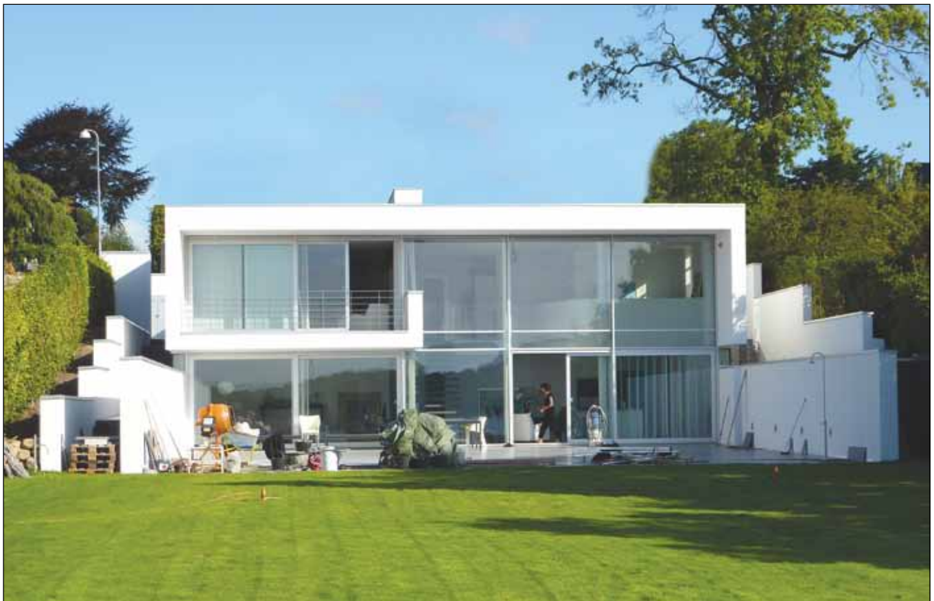
Facade mod Svendborgsund i to etager.

Gårdhaven og dermed udsigten omkranses af terrænmure, som leder udsigten og skaber perfekte forhold for ugenert udeophold. I gårdhaven er der forberedt for placering af udekøkken. Et meget fint og spændende hus som har udnyttet terrænet til det optimale. Materialeholdningen er hvidpussede facader med alluvinduer.