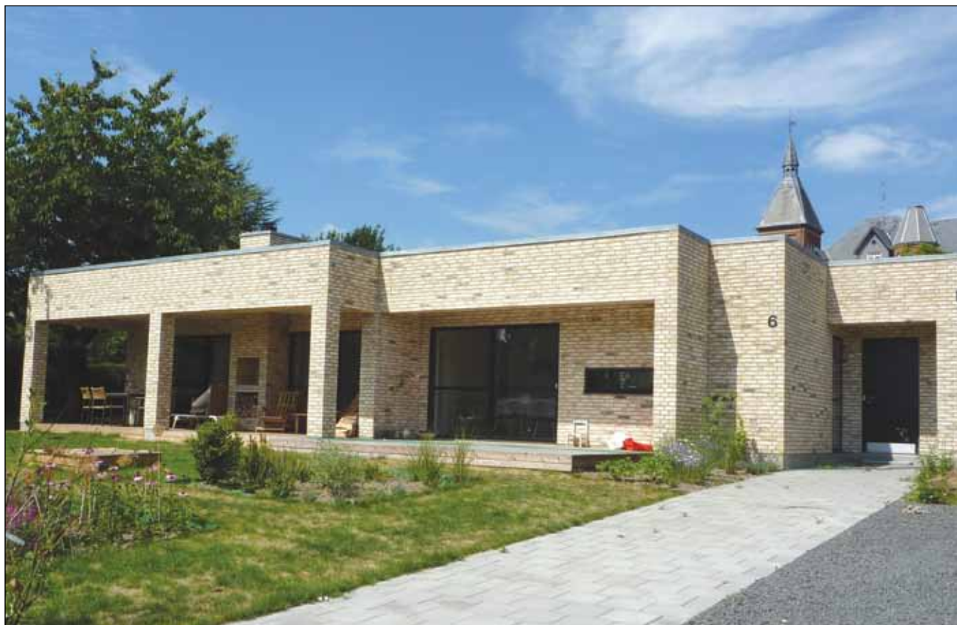
Hovedfacaden mod Græskæmnervej.

Husets gedigne materialevalg, form og funktion afspejler en meget enkel arkitektur og er et fint eksempel på, hvorledes et parcelhuset også kan udføres.