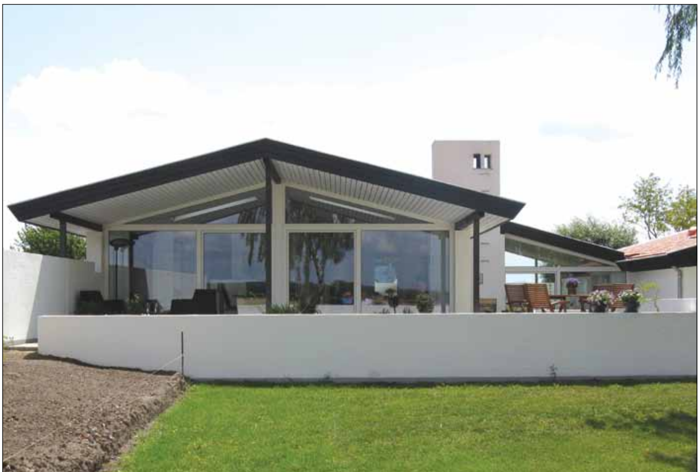
Huset fremstår med sit store tag og mange fine detaljer meget let, hvilket understreges af de store vinduespartier, der er placeret, således at huset gennemstrømmes af lys fra to eller flere sider.

Bebyggelsen udgør således en sluttet helhed, hvor detaljen har haft stor betydning for opfattelsen af huset arkitektur.