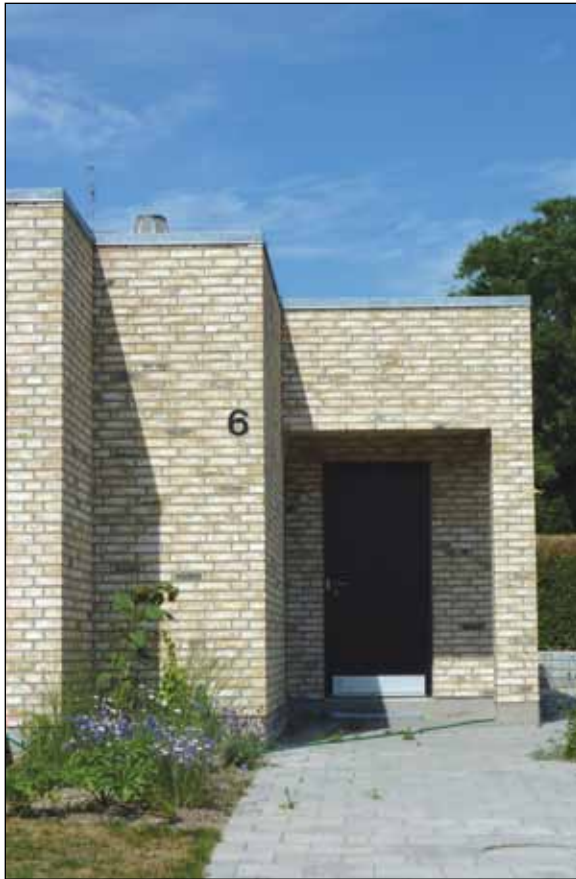
Facaderne er opmuret i gule blødstrogne teglsten.