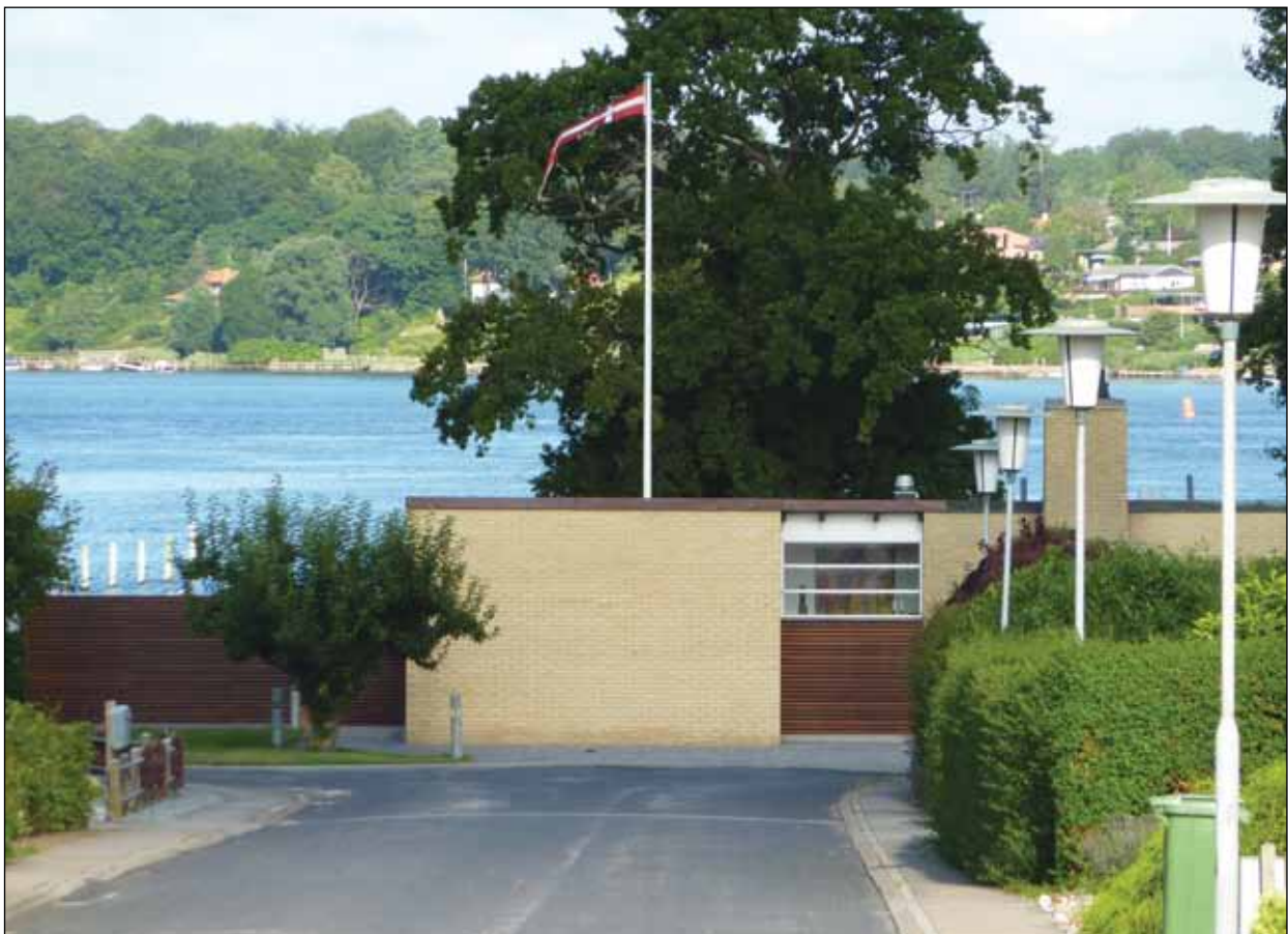
Tilbygningen er fint tilpasset den eksisterende arkitektur og fremstår i harmoni med dette.