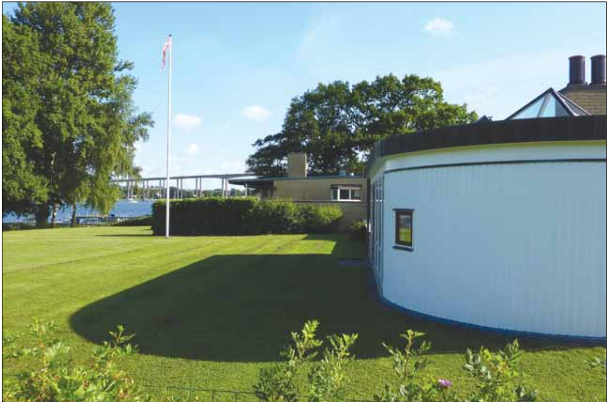
Udtryksformen er et godt eksempel på den såkaldt funktionelle tradition med maritime træk, hvilket især kan bemærkes i havestuen.