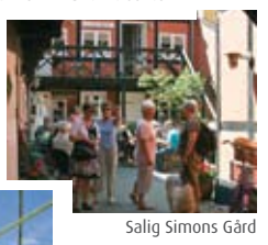
2 Salig Simons Gård