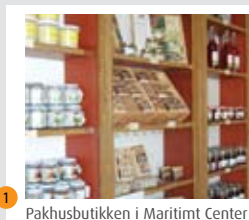
1 Pakhusbutikken i Maritimt Center