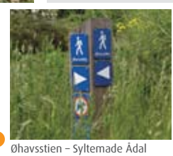
7 Øhavsstien – Syltemade Adal