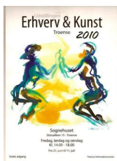
Årets plakat 2010

Udstillingen "Erhverv & Kunst 2011" åbner den 24. juni kl. 14.00 i Sognehuset samtidig med åbningen af Troense Informationscenter for sæson 2011.